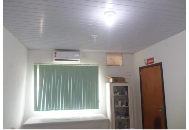
VÃO NA PAREDE (AR CONDICIONADO)