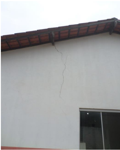
TRINCA NA PAREDE