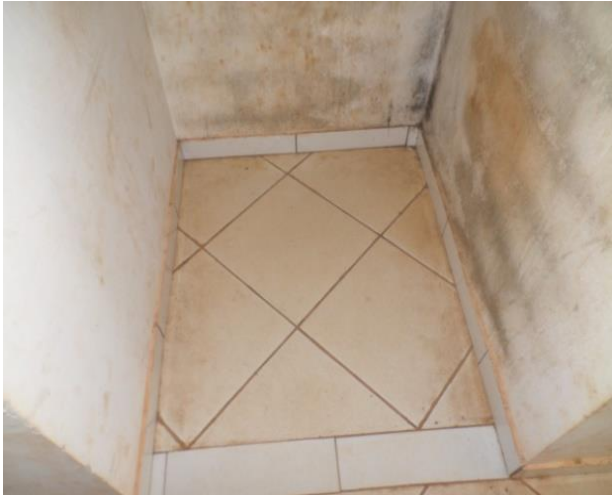
MOFO NAS PAREDES E PISO MANCHADO