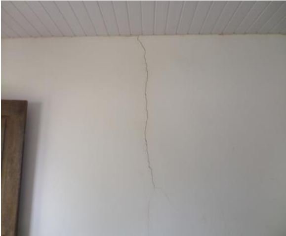
TRINCA NA PAREDE