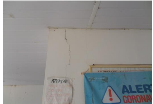
TRINCA NA PAREDE