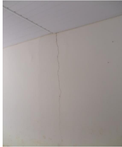
TRINCA NA PAREDE