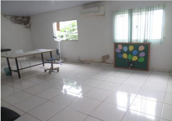
MOFO E INFILTRAÇÃO NAS PAREDES