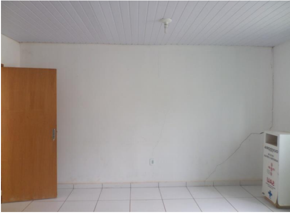
TRINCA NA PAREDE