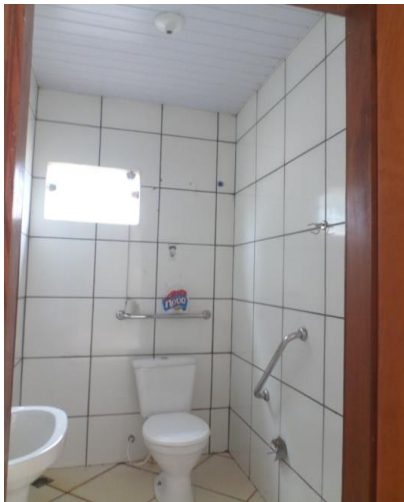
INSTALAÇÃO DE LAMPADA