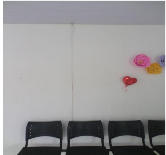
TRINCA NA PAREDE