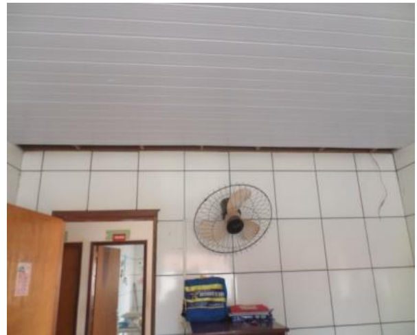
VENTILADOR DANIFICADO E FORRO QUABRADO