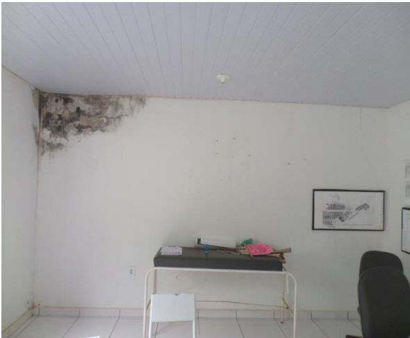
INFILTRAÇÃO DE AGUA NA PARTE SUPERIOR DA PAREDE