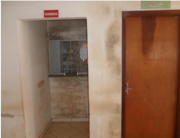
MOFO NAS PAREDES