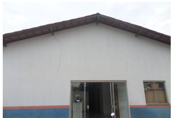
TRINCA NA PAREDE