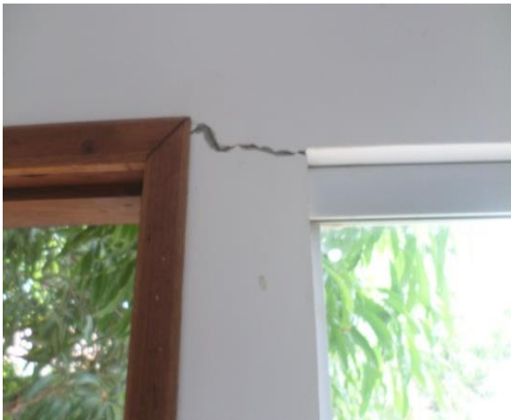
TRINCA NA PAREDE