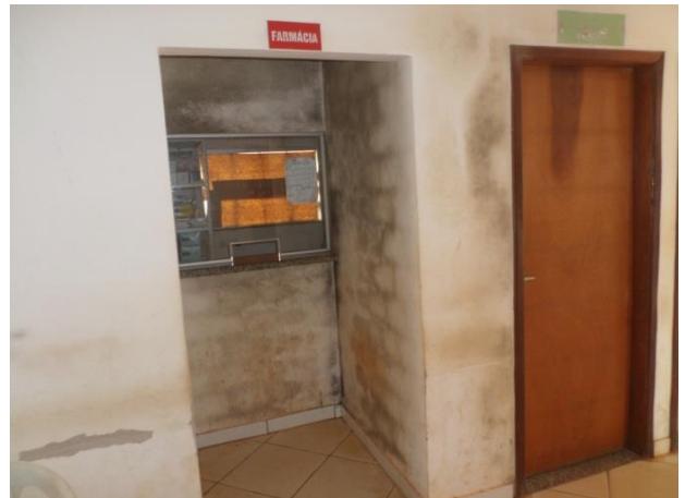
MOFO NAS PAREDES