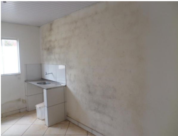
MOFO NAS PAREDES