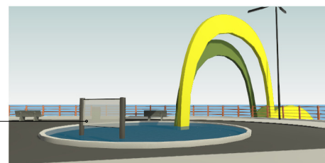
VISTA DO TOMEM - VISTA DO MONUMENTO DA GAIIVOTA