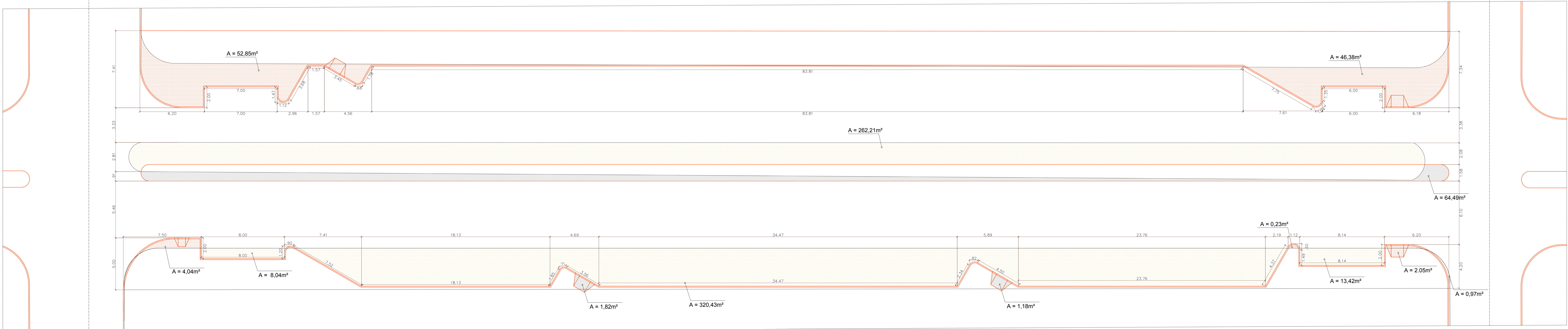
PLANTA BAIXA - DEMOLIR E CONSTRUIR escala 1:125