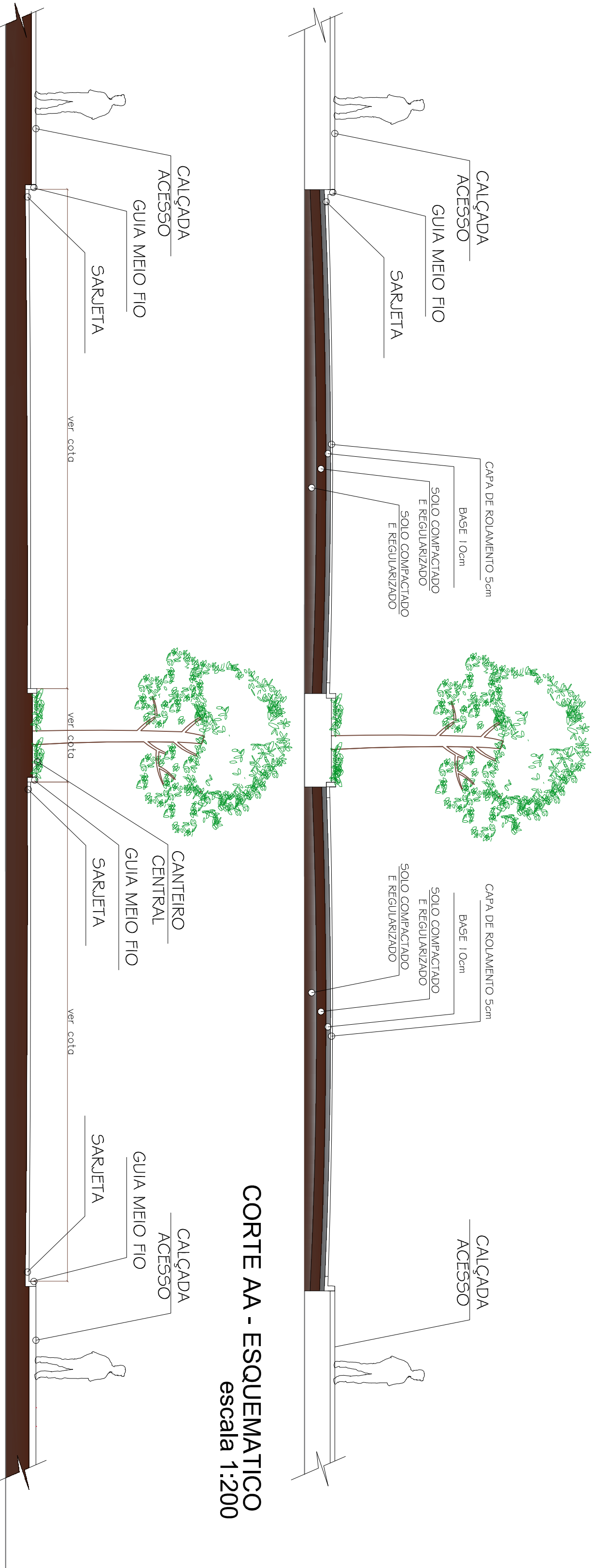
CORTE AA - ESQUEMATICO escala 1:200